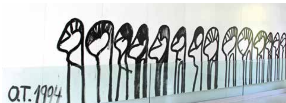
Oswald Tschirtner © Privatstiftung - Künstler aus Gugging, Foto: museum gugging

Eine künstlerische Besonderheit der villa gugging sind die von Oswald Tschirtner gestalteten Holzplatten, mit denen die Seitenwände des Saals verkleidet sind.