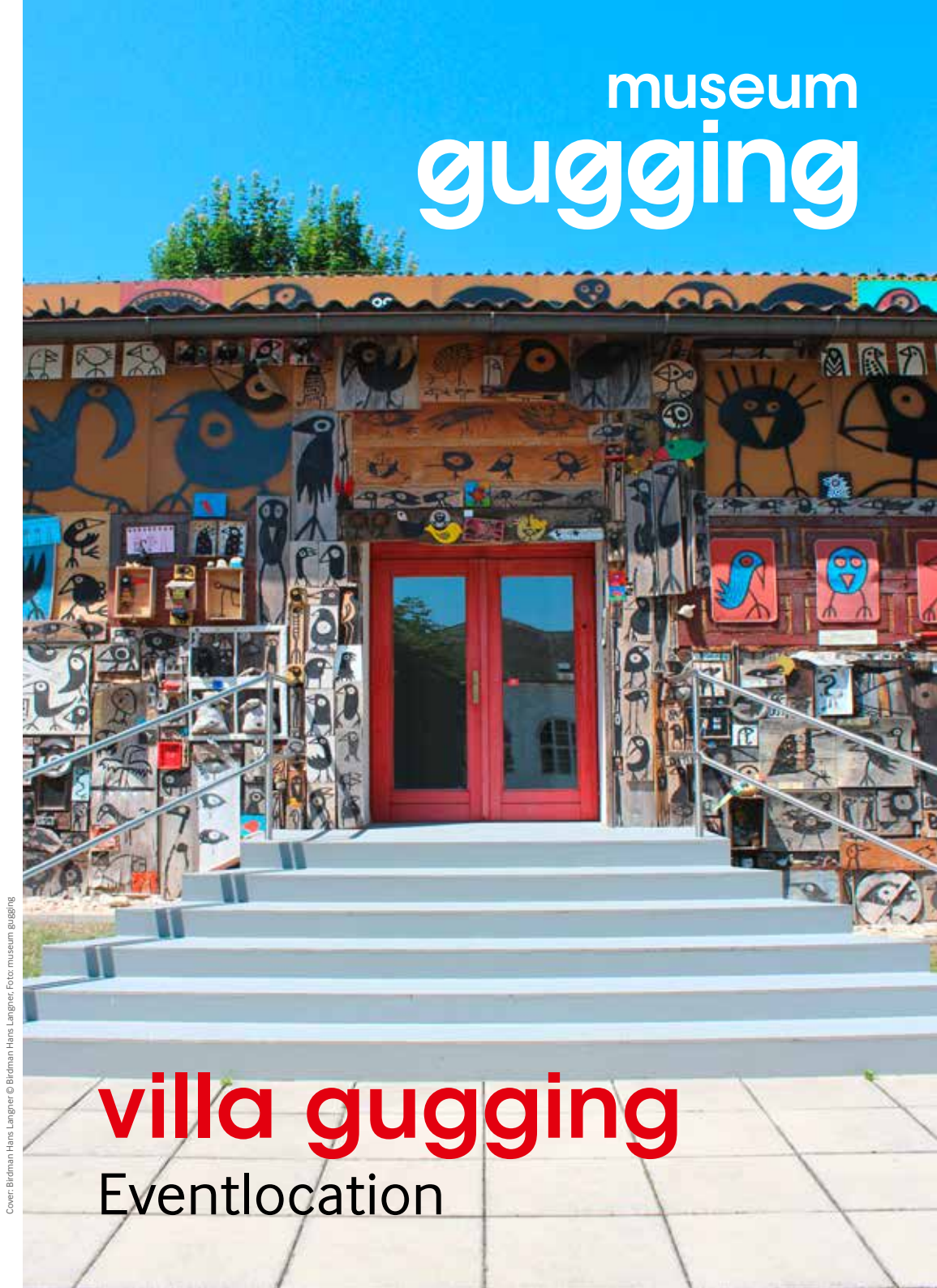
Cover: Birdman Hans Langner © Birdman Hans Langner