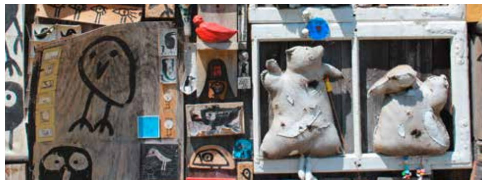
Birdman Hans Langner © Birdman Hans Langner, Foto: museum gugging